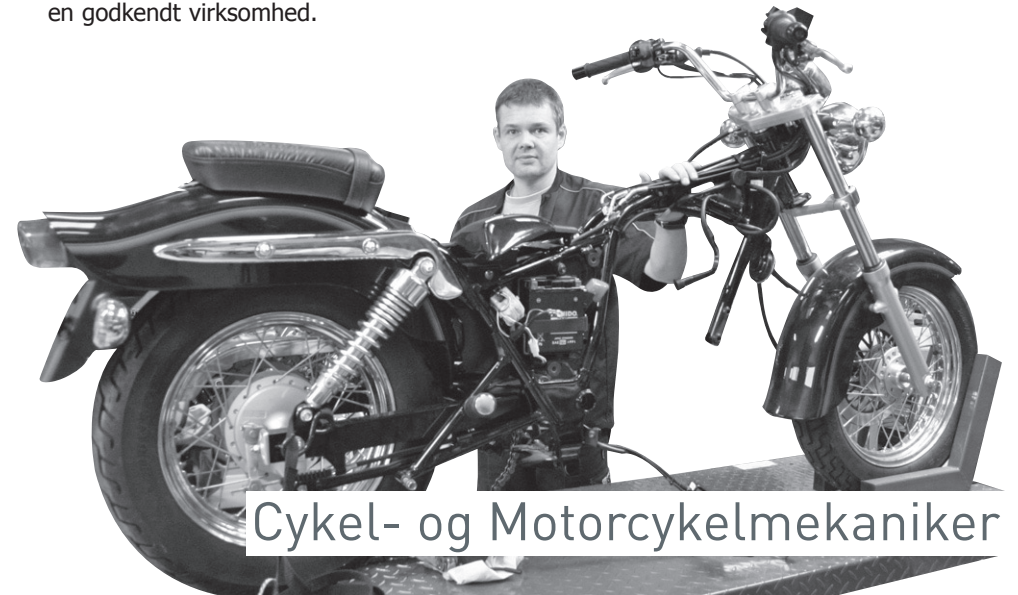
Cykel- og Motorcykelmekaniker

Efter grundforløbet starter du på hovedforløbet, hvor adgangskravet er et bestået grundforløb og en uddannelsesaftale med en godkendt virksomhed.